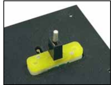
リードタイプ用テストヘッド