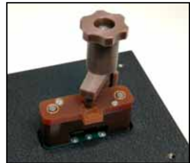
SMDタイプ用テストヘッド